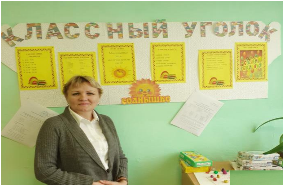
Классный уголок 2 класса