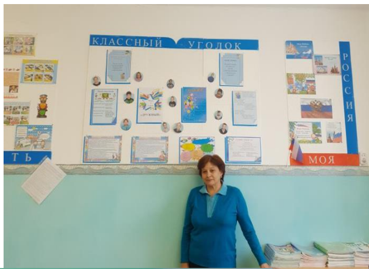
Классный уголок 5,6 класса