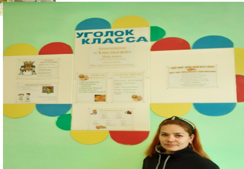
Классный уголок 3 класса